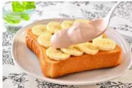
チョコバナナトースト