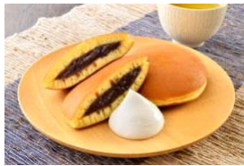
クリームどら焼き