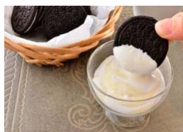
クッキーディップ