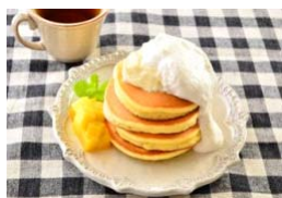
ホイップ&パンケーキ