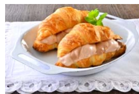
チョコクロワッサン