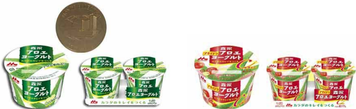
森永アロエヨーグルト

「森永アロエヨーグルト」は「素肌とカラダのために」というコンセプトのもと、1994 年 12 月 10 日に発売しました。発売当時、ヨーグルトは“デザート的一种”としてしか考えられていませんでしたが、ヨーグルトに「美容と健康」という新たな概念を切り開き、発売からわずか 1 年足らずでフルーツヨーグルト市場のトップシェア商品になりました。2008 年モンドセレクションにおいて金賞を受賞(表参照)。また、8 月 5 日(火)より、アセロラ果汁の入った甘酸っぱいヨーグルト「森永 アセロラアロエヨーグルト」を全国にて新発売いたします。