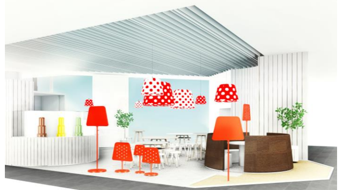
「pinofondue café」東京の店内イメージ画像

2015年7月に期間限定オープンした「pinofondue café -chocolate & marshmallow-」は、「ピノ」史上初めてオープンした「ピノ」のピノフォンデュ(※)専門店、東京・原宿のオシャレで楽しい“コト”が好きな女性をメインターゲットに、楽しくハッピーになれる“ピノフォンデュ体験”を提供し、来場者数が5万人を超え大好評でした。2016年はお客さま様のニーズを捉えて更にパワーアップし、新コンセプト「PINO COORDINATE (ピノコーディネート)」を軸に、東京・原宿に加え、初出店となる大阪・梅田の2箇所で、期間限定オープンいたします。