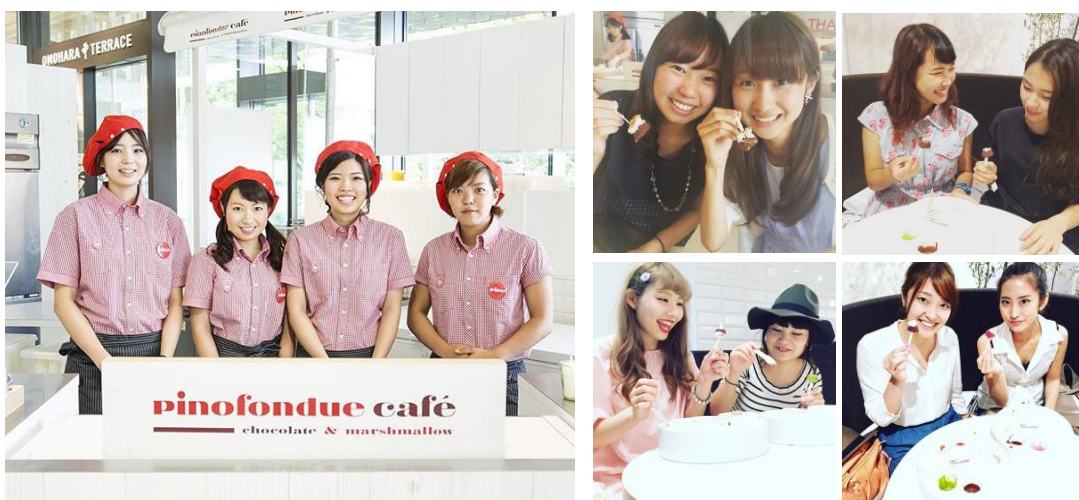
「ピノフォンデュカフェ」2015年の様子

「pinofondue café chocolate&marshmallow」は、情報感度が高く毎日を自分らしく楽しむ、オシャレで楽しい“コト”が好きな、10代後半～20代の女性をメインターゲットにしています。より幅広いお客さまに楽しんでいただくため、今年新たに大阪・梅田にもオープンいたします。