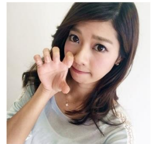
がぁーポーズ 片手あるいは両手をライオンの脚のような形にしたポーズ。