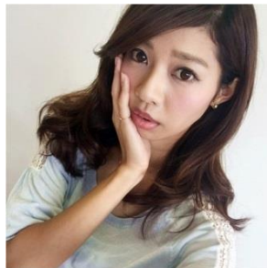
虫歯ポーズ 片手を頬にあてたポーズ。まるで歯が痛いような状態に見えることからこの呼び名に。