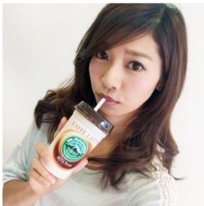
ストローで飲料を飲むポーズ(ニアチューポーズ) ストローで飲み物を飲んでいるポーズ。ストローポーズとも呼ばれる。

はじめに、SNSなどで話題になっている4つの女性の“自撮り”ポーズについて、「かわいい」と思うものはどれかを調べました。“自撮り”は、スマートフォンなどで女性が自分自身を被写体として写したものと定義。調査の対象としたのは、「ストローで飲料を飲むポーズ」を含めた、以下の4つのポーズです。