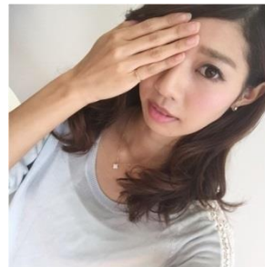
目隠しポーズ 片手で片目を隠すように覆ったポーズ。呼ばれ方は様々。