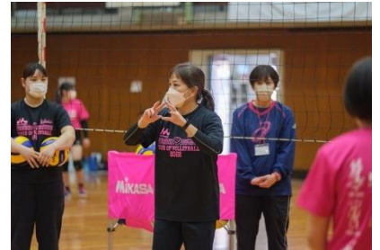
▲「森永乳業杯 ツアーオブバレーボール2022」の様子

森永乳業と姫路ヴィクトリーナはスポーツと未来ある子どもたちを応援してまいります。