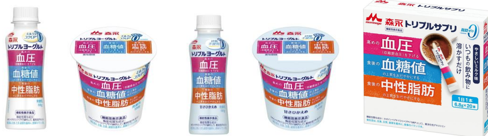
左から トリプルヨーグルト ドリンクタイプ / トリプルヨーグルト / トリプルヨーグルト 砂糖不使用 ドリンクタイプ / トリプルヨーグルト 砂糖不使用 / トリプルサブリ やさしいミルク味