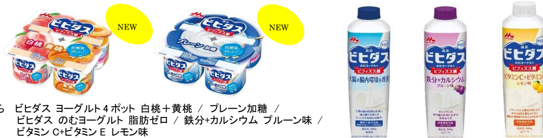
※左から ビヒダス ヨーグルト 4ポット 白桃+黄桃 / プレーン加糖 / ビヒダス のむヨーグルト 脂肪ゼロ / 鉄分+カルシウム フルーン味 / ビタミン C+ビタミン E レモン味