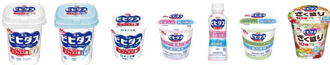
※左から ビヒダス プレーンヨーグルト / ビヒダス プレーンヨーグルト 脂肪ゼロ / ビヒダス プレーンヨーグルト 加糖 / ビヒダス ヨーグルト 便通改善 / ビヒダス ヨーグルト 便通改善 ドリンクタイプ / ビヒダス ヨーグルト KF / ビヒダス ヨーグルト ざく盛りフルーツ