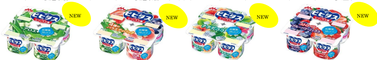
※左から ビヒダス ヨーグルト 4ポット アロエ / バラエティパック / ナタデココ / ストロベリー+ブルーベリーミックス