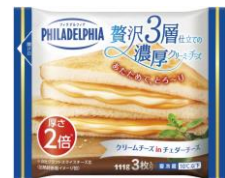
フィラデルフィア 贅沢3層仕立ての濃厚クリーミーチーズ