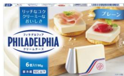
フィラデルフィア クリームチーズ 6P プレーン/香ばしオニオン