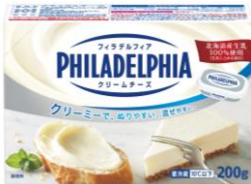
フィラデルフィア クリームチーズ 200g