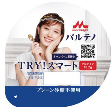
限定パッケージ (蓋)

「ギリシャヨーグルト パルテノ(以下、パルテノ)」は、ギリシャ伝統の“水切り製法”を踏襲し、こだわりのひと手間によりゆっくり丁寧に作られた、日本初(※1)のギリシャヨーグルトです。ギリシャで昔から受け継がれてきた健康への知恵と、カラダのことを考えるやさしい愛が日本でも親しまれるようになって欲しい。そんな想いとこだわりのひと手間により、パルテノには「おいしさ」だけでなく「プロテイン(たんぱく質)」が“ぎゅっと”詰まっています。