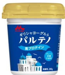
※6/29(火)発売/コンビニエンスストア除く プレーン砂糖不使用 280g