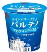
プレーン砂糖不使用(100g)