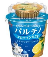
レモンジンジャーソース付(89g)

ギリシャヨーグルト パルテノ PR 事務局(株式会社サニーサイドアップ内)担当:池田、蜂須賀 MAIL: partheno@ssu.co.jp / TEL: 03-6894-3251 / FAX: 03-5413-3232 池田携帯: 080-7534-3276 / 蜂須賀携帯: 080-4069-0740