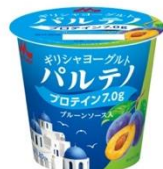
ブルーベリーソース入(80g)