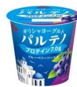
ブルーベリーソース入(80g)