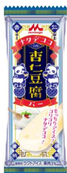
「ナタデココ in 杏仁豆腐バー」 140円(税別)