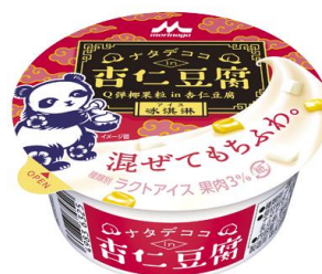
「ナタデココ in 杏仁豆腐」 140円(税別)