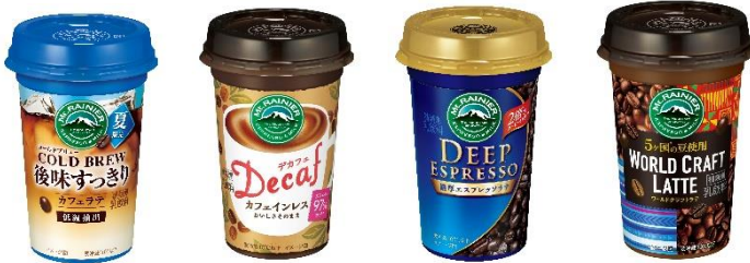
コールドブリュー / デカフェ / ディープ エスプレッソ / ワールド クラフトラテ