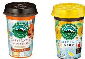
ソルティキャラメル / 夏とゆず ～ロレーヌの風感じる～