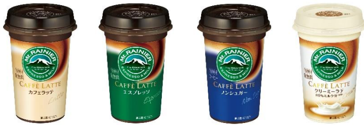
カフェラッテ / エスプレッソ / ノンシュガー / クリーミーラテ