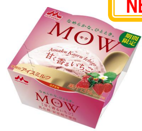
MOW(モウ) 甘く香るいちご

エチオピアモカを100%使用した個性ある風味と、ミルクのコクがバランス良く味わえるコーヒーアイスです。エチオピアモカ本来のまろやかな酸味と華やかな香りをお楽しみいただけます。