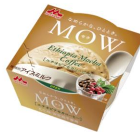
MOW(モウ) エチオピアモカコーヒー

元禄年間から約300年続く老舗茶園の宇治「丸久小山園」の宇治抹茶を100%使用しています。2種類の抹茶をブレンドし、旨みと苦みのバランスが良い味わいに仕上げました。パッケージは京都の老舗手ぬぐい屋「永楽屋」とコラボレーションした3種類を展開します。