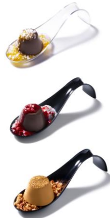
3種類の「ピノ」を使った特別メニュー

クッキークランチ、アーモンドクランチを敷き詰めた上に、クリスピーキャラメルクリーム、ピノアーモンド味、紅茶パウダーを重ね、ナッツとクッキーの香ばしさと豊かな風味が味わえる一品です。