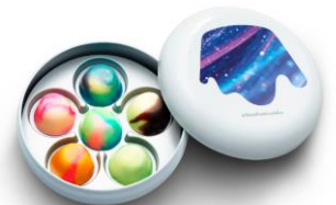
room ‘イロ’体験の完成イメージ

8色のチョコレートソースから4色を選んで、自由に色を混ぜて、好きな模様をつくりまします。チョコレートソースにピノアイスをディップして、自分だけの「ピノ」をカラーリングしていきます。カラーリングした「ピノ」を pinofantasia（ピノファンタジア）限定缶にセットし、6粒揃ったら完成です。