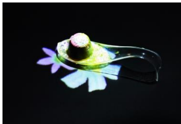
room‘ヒカリ’体験イメージ1

美しくスプーンに盛り付けた3種類の「ピノ」を使った特別メニューをお楽しみいただけます。