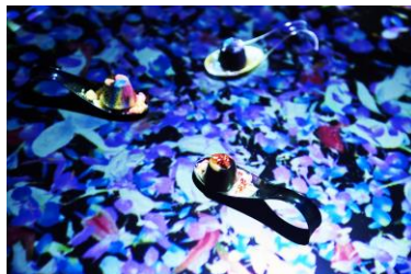
room‘ヒカリ’体験イメージ2