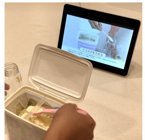
「育児サポートスキル」使用イメージ

なお本サービスは、「Amazon Alexa」に対応した画面付きデバイスに対応しており、これらをお持ちの方は無料でご利用いただけます。