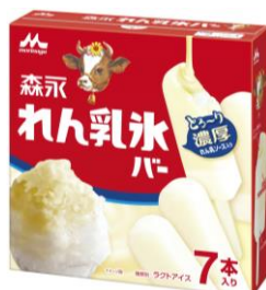
「森永 れん乳氷バー(7本入り)」 オープン価格