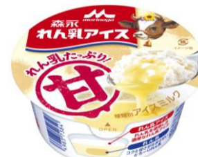
「森永 れん乳アイス」140円(税別)