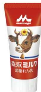
「森永ミルク 加糖れん乳」 190円(税別)