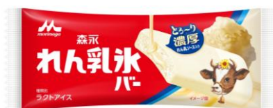
「森永 れん乳氷バー(1本入り)」 140円(税別)