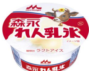
「森永 れん乳氷 / れん乳氷 いちご」140円(税別) ※9月末ごろまで発売