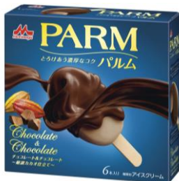
PARM(パルム) チョコレート&チョコレート ~厳選力カオ仕立て~(6本入り)