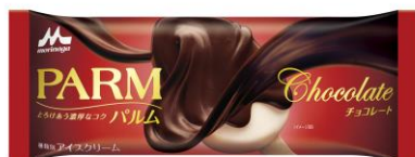
PARM(パルム) チョコレート(1本入り)