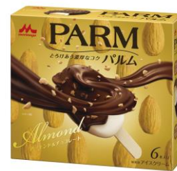
PARM(パルム) アーモンド&チョコレート (6本入り)