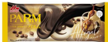
PARM(パルム) アフガート(1本入り)