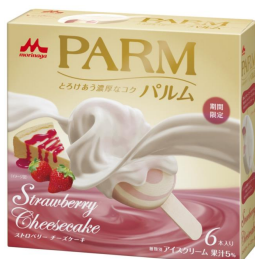
PARM(パルム) ストロベリーチーズケーキ(6本入り)