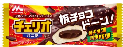
チェリオ バニラ(1本入り) 希望小売価格:140円(税別) 内容量:85ml