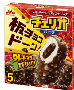
チェリオ バニラ(5本入り) 希望小売価格:オープン価格 内容量:250ml(50ml×5本)