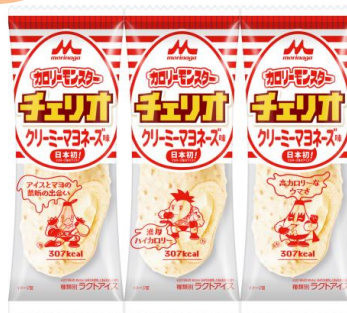
カロリーモンスターチェリオ クリーミーマヨネーズ味(1本入り) 希望小売価格:140円(税別) 内容量:85ml