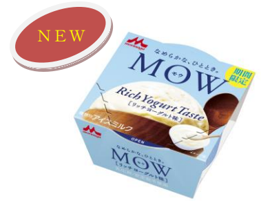
MOW(モウ) リッチヨーグルト味

エチオピアモカを100%使用した個性ある風味と、ミルクのコクがバランス良く味わえるコーヒーアイスです。エチオピアモカ本来のまるやかな酸味と華やかな香りをお楽しみいただけます。