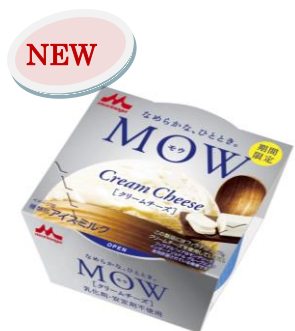
MOW(モウ) クリームチーズ