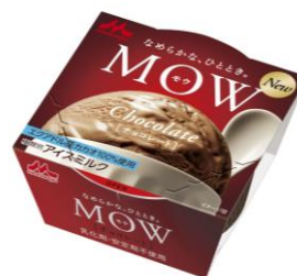
MOW(モウ) チョコレート ～エクアドルカカオ～