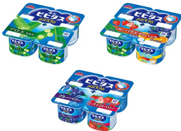
「森永ビヒダス4ポットシリーズ」