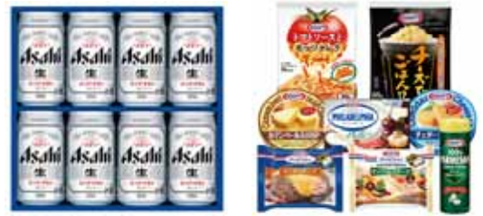
<キャンペーン パッケージ>

受付時間 6月5日(水)~9月30日(月) 10:00~17:00(土・日・祝日を除く)