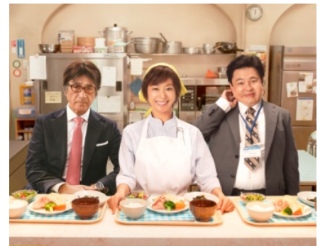
2013年5月25日(土)より 角川シネマ有楽町ほか全国ロードショー ©2013「体脂肪計タニタの社員食堂」製作委員会