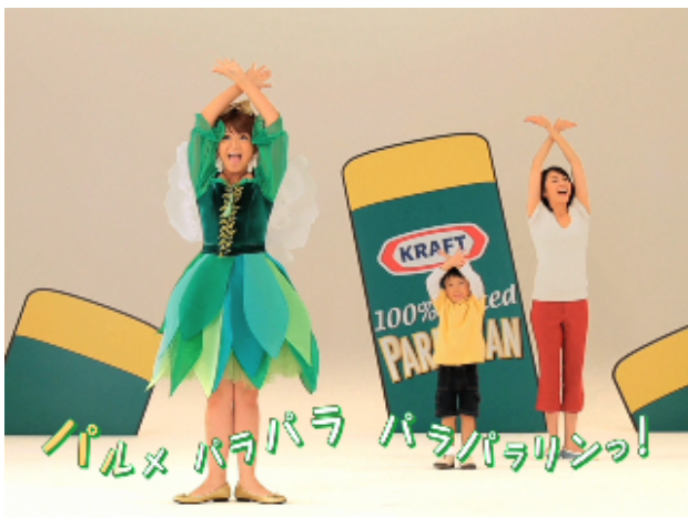
【矢口真里 & 親子】

12月10日にオープンする新WEBサイトでは、タレントの矢口真里さんが一組の親子と共に、この「パルメパラパラダンス」に挑戦した映像を公開、さらにタレントのダンテ・カーヴァーさんも特別出演しており、一味違ったパラパラダンスを披露します。