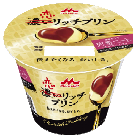
「恋愛ニート」特別パッケージ