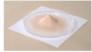
<ラクトフェリン粉末>

中でも母乳、特に初乳に多く含まれており、抵抗力の弱い赤ちゃんを病原菌やウイルスなどの感染から守る重要な成分として考えられています。