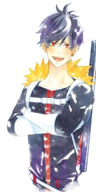
<ウェルシュ菌(悪玉菌)>