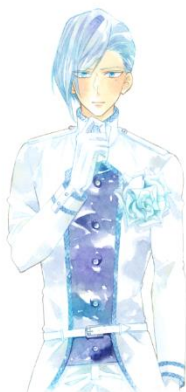
<ビフィダム菌(善玉菌)> ※ビフィズス菌の一種