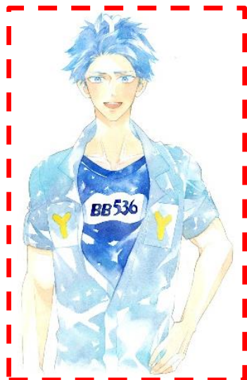
<イサム君ことBB536(善玉菌)> ※ビフィズス菌の一種