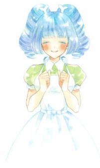
<ロンガム菌(善玉菌)> ※ビフィズス菌の一種