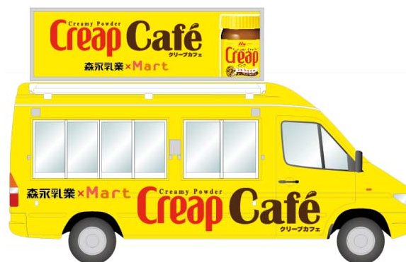
<“クリープカフェ”キャラバンキッチンカー>