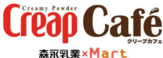
<“クリープカフェ”キャラバンロゴ>

今後も、「森永クリープ」はミルク生まれという最大の特長を活かし、様々な活用法を提案し、お客さまの豊かで楽しい、ご家族との食生活を便利に支える商品として貢献して参ります。