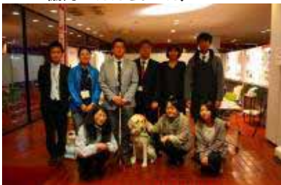
盲導犬の歩行体験の様子