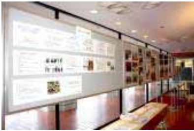
寄付先団体のパネル展示